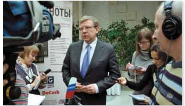
Конференция «Банковская система России 2011: тенденции и приоритеты посткризисного развития»

Издательство «ИнтерКрим-пресс» благодарит компанию «Гамма-Центр» и надеется на продолжение сотрудничества в 2012 г.