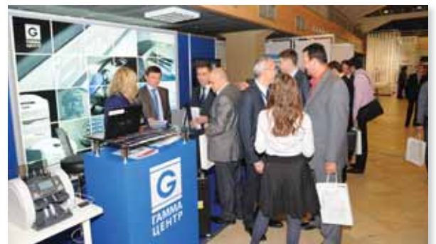
Стенд компании «Гамма-Центр» на III Международном форуме «Банковское самообслуживание и налично-денежное обращение: Cash-out. Cash-in. Cash-ресайклинг. Россия и СНГ»