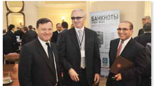
XXII съезд Ассоциации российских банков